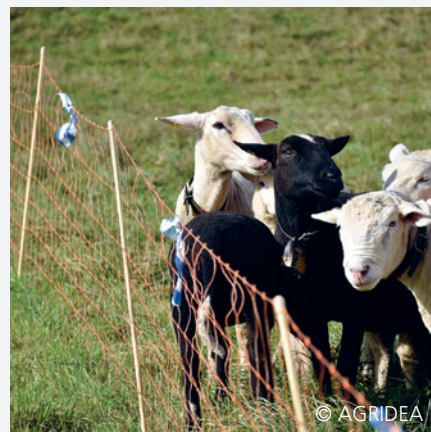
Weidenetz mit Flutterband blau-weiss

Einsatzzweck: Gilt für Luchs und Wolf, nicht für Braunbär