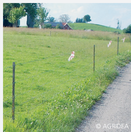
Fünf-Litzenzaun mit Flutterband rot-weiss

Kantonale Herdenschutzberatung – www.herdenschutzschweiz.ch > Kontakte