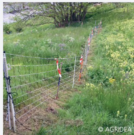
Weidenetz mit Flutterband rot-weiss

Merkblatt: «Wolfschutzzäune auf Kleinviehweiden», AGRIDEA