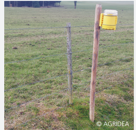
Fünf-Litzenzaun mit Blinklampe

Merkblatt: «Wolfschutzzäune auf Kleinviehweiden», AGRIDEA